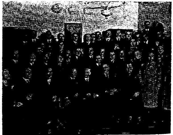
Ὁ Ὑφυπουργὸς τοῦ Πολιτικοῦ Γραφείου κ. Μπουμπούλης φωτογραφούμενος μετὰ τῶν καθηγητῶν τοῦ Πανεπιστημίου καὶ μέρους τῶν συμμετασχόντων τῆς ἑορτῆς χημικῶν.

Τὸ ἐν λόγῳ συγκρότημα συνέχεται δι' εὐρέος διαδρόμου μετὰ τῶν γραφείων. Ταῦτα ἀπαρτίζονται ἀπὸ τὸ γραφεῖον τοῦ Δ. Σ., ἀπὸ τὸ γραφεῖον τῶν «Χημικῶν Χρονικῶν», λίαν εὐρύχωρον δωμάτιον