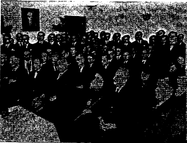
Οἱ κεκλημένοι παρακολουθοῦντες τὴν ἄγόμευσιν τοῦ Ἀντιπροέδρου κ. Κώνστα.

Ἡ ἀπὸ διετίας συνεχιζομένη ἐντατικὴ ἐργασία διὰ τὴν πλήρη ἀναδιοργάνωσιν τῆς Ἐνώσεως Ἑλλήνων Χημικῶν ἔφερε τοὺς ἰθύνοντας αὐτὴν εἰς τὴν ἀπόφασιν τῆς ἰδρύσεως τοῦ Ἐντευκτηρίου, τῆς ἰδρύσεως ἑνὸς πραγματικοῦ οἴκου τῶν χημικῶν. Ἡ ἐργασία τοῦ χημικοῦ, κατ' ἐξοχὴν βαρεία, ἀποστερεῖ αὐτὸν