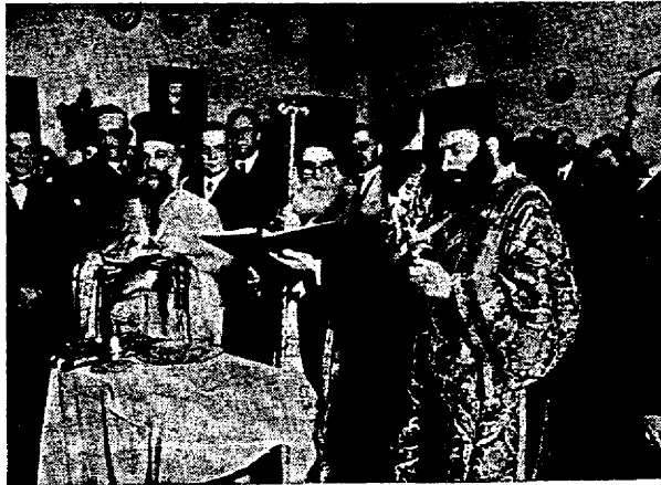
Ἡ τέλεσις τοῦ ἁγιασμοῦ, χοροστατοῦντος τοῦ Παναγιωτάτου Μητροπολίτου Θεσσαλονίκης κ. Γενναδίου.

Ἐν τέλει προσεφέρθησαν ἀναψυκτικά. Ὁ Ὑφυπουργὸς τοῦ Πολιτικοῦ Γραφείου κ. Μπουρμπούλης ἐγείρων τὸ ποτήριον τοῦ καμπανίτου εἶπε περίπου τὰ ἀκόλουθα: «Ἐκ μέρους τῆς Κυβερνήσεως ποιούμεν τὴν δῆλωσιν ὅτι τὰ ζητήματά σας θὰ ἐξετασθοῦν μετὰ πάσης εὐμενείας. Ἀναγνωρίζω τὴν μεγάλην συμβολὴν τοῦ χημικοῦ εἰς τὸ Κρατικὸν σύνολον. Ἡ Ἐθνικὴ Κυβέρνησις εἶναι ἀποφασισμένη καὶ προδιατεθειμένη νὰ προστατεύσῃ κάθε δικαίον καὶ λογικὸν αἴτημα παντὸς ἐργαζομένου εἴτε εἰς τὸν ἐργατικὸν κόσμον εἴτε