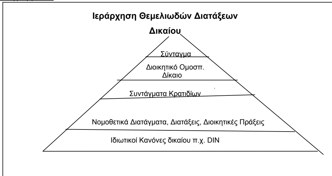
Διάγραμμα 3 :

Το Ευρωπαϊκό Δίκαιο υπερισχύει του ομοσπονδιακού δικαίου, είναι lex specialis σε σχέση με το γερμανικό δίκαιο, δηλ. το ευρωπαϊκό δίκαιο διεισδύει σε όλες τις περιγραφόμενες στην πυραμίδα περιοχές δικαίου.