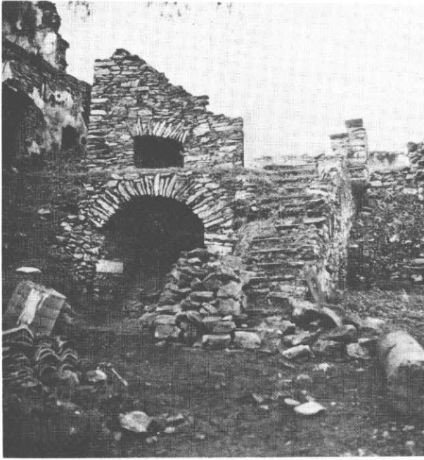
Επάνω: Η Μονή Καισαριανής πριν αναστηλωθεί από την Φιλοδοσική. Δεξιά: Μετά την αναστήλωση