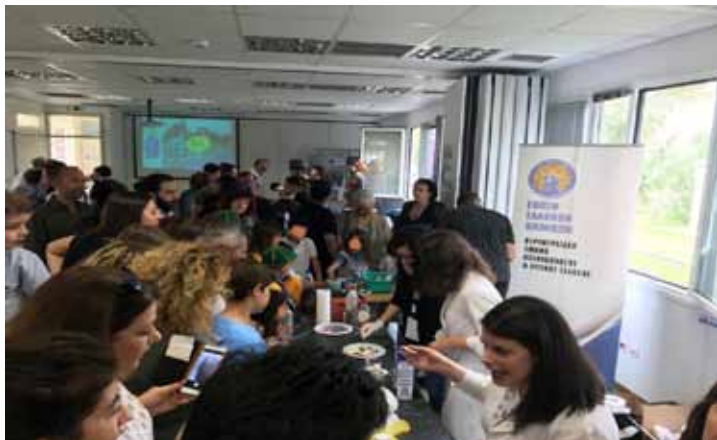
Εντυπωσιακή ήταν και φέτος η προσέλευση του κόσμου

παρευρέθησαν ήταν εντυπωσιακή, καθώς τόσο μικροί, όσο και μεγαλύτεροι παρακολούθησαν με μεγάλο ενδιαφέρον τα πειράματα επίδειξης.