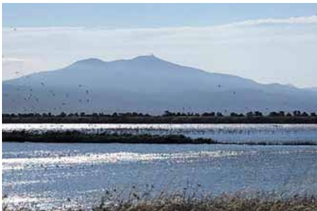
Φωτογραφία 1. Η Λιμνοθάλασσα του Καλοχωρίου, με τα πάρα πολλά είδη πουλιών.

Η περιήγηση μας ξεκίνησε από τη λιμνοθάλασσα του Καλοχωρίου, όπου περπατήσαμε στο ειδικά διαμορφωμένο μονοπάτι που διασχίζει τη λιμνοθάλασσα και είχαμε την τύχη να δούμε