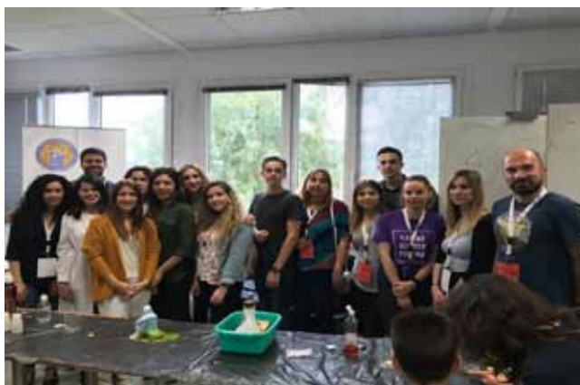
Η ερευνητική ομάδα Χημείας Περιβάλλοντος του Παν. Πατρών μαζί με την ομάδα επίδειξης πειραμάτων του Π.Τ.Π.Δ.Ε. της Ε.Ε.Χ. κατά την τελευταία ημέρα του φεστιβάλ

Οι μαθητές συμμετείχαν με ενθουσιασμό στα πειράματα αυτά, ενώ σίγουρα τα ερεθίσματα, που έλαβαν έδωσαν το έναυσμα για περαιτέρω συζήτηση στην τάξη.