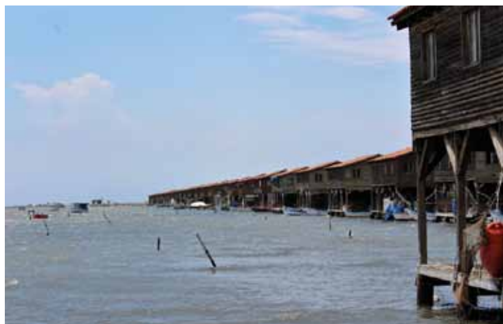
Φωτογραφία 2. Άποψη από τις καλύβες των Μυδοκαλλιεργητών στο δέλτα του Αξιού.

Το ΠΤΚΔΜ, το ΤΠΥΑΕ και ο ΣΧΒΕ τονίζει την ανάγκη διατήρησης και προστασίας του περιβάλλοντος της περιοχής, η οποία αποτελεί κόσμημα για το νομό Θεσσαλονίκης και συγχαίρει το προσωπικό του φορέα διαχείρισης για τις προσπάθειες τους,