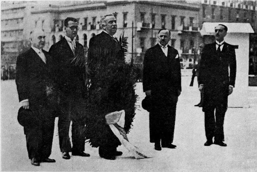
Τὸ Προεδρεῖον τοῦ Συνεδρίου καταθέτει στέφανον πρὸ τοῦ Μνημείου τοῦ Ἀγνώστου Στρατιώτου.

Εἶναι ἀληθές ὅτι τὸ ἐπάγγελμα τοῦ χημικοῦ ἐξασκεῖται ὑπὸ συνθήκας δυσμενεῖς. Ἡ ἀτμόσφαιρα τῶν χημικῶν ἐργαστηρίων καὶ ἐργοστασίων δὲν εἶναι οὔτε εὐχάριστος, οὔτε ὑγιεινὴ καὶ ὄλοι μας εἶδαμεν κυρίας ἐπισκεπτομένας ἐργοστάσια νὰ προστατεύονται συχνὰ μὲ ἀρωματισμένα μανδύλια καὶ νὰ κοιτάζουσαν πάντοτε πρὸς τὴν ἔξοδον. Ὁ ἀπαραίτητος συνδυασμὸς τῆς ἐντατικῆς διανοητικῆς καὶ σωματικῆς ἐργασίας μᾶς καταβάλλουν, ὅπως εἶναι στατιστικῶς ἀποδεδειγμένον, πολὺ ἐνωρίτερον ἀπὸ ἄλλους ἐπιστήμονας. Ἐὰν εἰς ταῦτα προσθέσω ὅτι ἐργαζόμεθα περιβαλλόμενοι ἀπὸ βιαίους ἢ λανθάνοντας ἐπαγγελματικὸς κινδύνους, ἀπὸ τοὺς ὁποίους πολλοὶ ἐξ ἡμῶν, ἐὰν δὲν