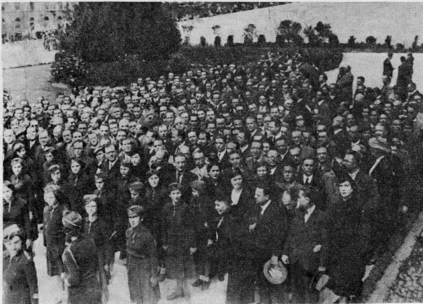
Οἱ Σύμβουλοι πρὸ τοῦ Μνημείου τοῦ Ἀγνώστου Στρατιώτου, ὀλίγον πρὸ τῆς καταθέσεως τοῦ στεφάνου.

Τὸ Τεχνικὸν Ἐπιμελητήριον τὸ ὁποῖον περιλαμβάνει μεταξὺ τῶν μελῶν του καὶ τοὺς χημικοὺς μηχανικοὺς, ἀπευθύνει δι' ἐμοῦ εἰς τὸ Συνέδριον τοῦτο θερμὸν χαιρετισμὸν καὶ εὐχεται ὅπως ἡ ἐπὶ τὸ αὐτὸ διὰ πρώτην φορὰν συγκέντρωσις τῶν ἐκλεκτῶν