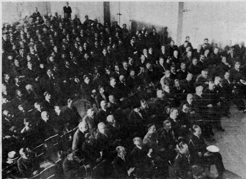
Ἀποφικ τῆς αἰθούσης τοῦ «Παρνασσού» διαρκούσης τῆς Πανηγυρικῆς Συνεδρίας.

Ἡ Ὑμετέρα Μεγαλειότης θὰ μοῦ ἐπιτρέψῃ νὰ τὴν παρακαλέσω, ὅπως εὐδοκήσῃ νὰ κηρύξῃ τὴν ἔναρξιν τοῦ Ἀ' Πανελληνίου Χημικοῦ Συνεδρίου.