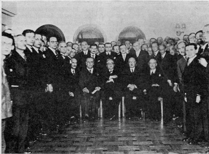
Ὁ Πρόεδρος τῆς Κυβερνήσεως καὶ οἱ κ. κ. Ὑπουργοὶ ἐν μέσῳ τῶν Συνέδρων μετὰ τὸ πέρας τοῦ γεύματος.

Εἶμαι, λέγω, ἀληθῶς εὐτυχῆς βλέπων τὸ σῶμα τῶν Ἑλλήνων χημικῶν συνηνωμένον μετὰ τοιούτου ἐνθουσιασμοῦ, ἐπιλαμβανόμενον τοῦ ἔργου τῆς ἀνυψώσεως τῆς ἐπιστήμης τοῦ ἐν τοιαύτῃ ἀδελφικῇ ἐνώσει καὶ μετ' ἀποφάσεως τοιαύτας, ὅσας ἐξήγγειλε πρὸ ὀλίγου ὁ ἀξιότιμος πρόεδρος τοῦ συν-