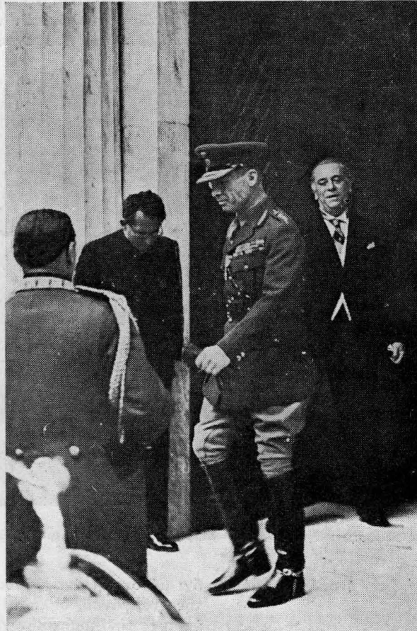
Ἡ Α. Μ. ὁ Βασιλεὺς ἀναχωρῶν ἐκ τοῦ «Παρνασσοῦ».

Καὶ ἐὰν τὰ Κράτη εἰς στιγμὰς σκληρῶν ἀγῶνων, ἐζήτησαν ἀπὸ τοὺς χημικοὺς τὰ μέσα τῆς ἐπικρατήσεως των πάλιν ἀπὸ αὐτοὺς οἱ προσβαλλόμενοι ἐζήτησαν καὶ ἐπέτυχον τὰ μέσα τῆς ἀμύνης των.