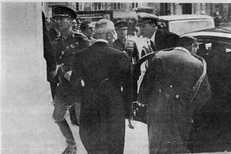
Ἡ Α. Μ. ὁ Βασιλεὺς καὶ ἡ Α. Β. Υ. ὁ Διάδοχος καθ' ἣν στιγμὴν προσέρχονται εἰς τὸν «Παρνασσόν».

Ἀισθάνομαι ἰδιαιτέραν χαρὰν, εὐχαριστῶν τοὺς ἀγαπητοὺς συναδέλφους, διὰ τὴν τιμὴν, τὴν ὁποίαν μοῦ ἔκαμαν, καλοῦντες με νὰ προεδρεύσω τοῦ Α΄ Πανελληνίου Χημικοῦ Συνεδρίου. Ἡ συγκίνησίς μου εἶναι ἀκόμη μεγαλύτερα, ὅταν βλέπω, ἐπ' εὐκαιρίᾳ τῆς πνευματικῆς αὐτῆς ἑορτῆς, νὰ ἐμφανίζονται συναδελφωμένοι, ὡς ἐνιαῖα καὶ γόνιμος κοινωνικὴ δύναμις, ὅλοι οἱ Ἕλληνες χημικοὶ, ἀνεξαρτήτως τῶν σχολῶν εἰς τὰς ὁποίας ἐφοίτησαν, ὅπως παρουσιάσουν μὲ ὑπερφάνειαν τὸ κοινὸν ἔργον, τὸ ὁποῖον