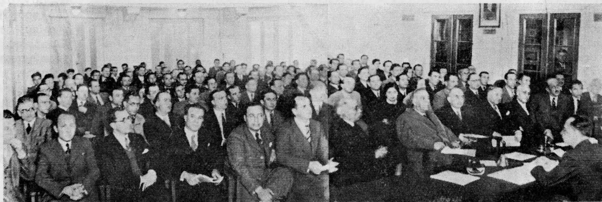
Ἀποφῆς τῶν Συνέδρων ἐν τῇ αἰθούσῃ τοῦ Ἐμπορικοῦ καὶ Βιομηχανικοῦ Ἐπιμελητηρίου.

«Εἶμαι εὐτυχῆς χαιρετίζων ἐξ ὀνόματος τοῦ διοι- κητικοῦ συμβουλίου τῆς Ἑταιρείας Λιπασμάτων εἰς τὸ σημερινὸν φιλικὸν μας γεῦμα, τοὺς ἀγαπητοὺς συναδέλφους, συνέδρους τοῦ Ἀ΄ Πανελληνίου Χημι- κοῦ Συνεδρίου. Ἡ ἐπίσκεψις τῶν ἐργοστασίων μας, οἷς ἔδωσε, κύριοι, τὴν εὐκαιρίαν ν' ἀντιληφθῆτε καὶ