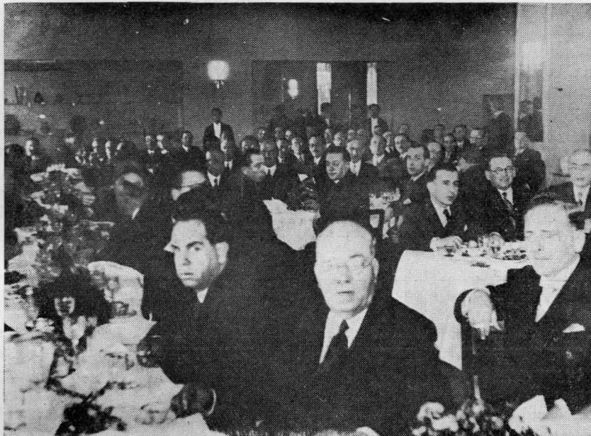
Στιγμιότυπον έκ του γεύματος εις τό ξενοδοχείον «Βασιλεύς Γεώργιος».

Έάν έξαιρέσωμεν όλίγας μεγάλας Βιομηχανίας, τάς όποιās πάλιν Έλληνες Χημικοί έδημιούργησαν και προήγαγον και αί όποιαι έγνώρισαν τήν μεγάλην σημασίαν τής έρεύνης, προς έξυπηρέτησιν αυτων των οικονομικων συμφερόντων, τά λοιπα έν τή Χώρα μας έργαστήρια, είναι τόσον πενιχρά, ώστε ή έκτέλεισις έν αυτοις οίασδήποτε, επιβαλλο-