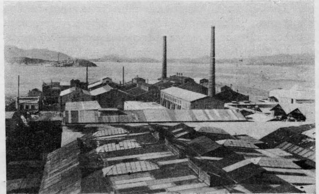
Δύο μερικαὶ ἀπόψεις, ἀπὸ τοῦ πύργου τῶν ὀξέων, τοῦ βιομηχανικοῦ συγκροτήματος τῆς Α. Ε. Χημικῶν Προϊόντων καὶ Λιπασμάτων

γεγονός. Διότι κατ' αὐτὴν ἐδόθη ἡ εὐκαιρία, πλὴν τῆς μελέτης καὶ λεπτομεροῦς ἐξετάσεως τῶν τελευταίων προόδων τῆς μεγαλυτέρας καὶ κατ' ἐξοχὴν ἐθνικῆς ταύτης βιομηχανίας τῆς χώρας, νὰ σφρηλατηθοῦν ἔτι μᾶλλον, εἰς τὴν ἐπακολουθήσασαν τὴν ἐπίσκεψιν φιλικὴν συγκέντρωσιν, οἱ ἄρρηκτοι δεσμοὶ συνεργασίας οἱ συνδέοντες τὴν ἐπιστήμην τῆς χημείας πρὸς τὸ παραγωγικὸν κεφάλαιον, οἷτινες ἀναμφισβητήτως συνέβαλον σημαντικώτατα εἰς τὴν σημερινὴν ἀκμὴν τῆς ἑλληνικῆς βιομηχανίας.