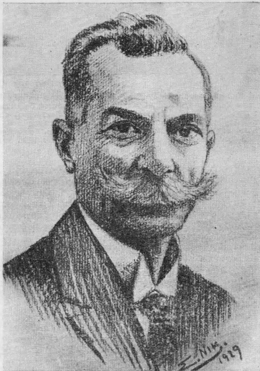
Ὁ πρῶτος Πρόεδρος τῆς Ε.Ε.Χ. Καθηγητὴς κ. Γ. Ματθαίουπουλος κατὰ σχεδιαγράφημα ἐνὸς μαθητοῦ τοῦ τοῦ 1929.

χημικοὺς τοῦ τόπου. Ἡ τελευταία αὐτὴ σχολή, ἡ ὅποια διαλύθηκε τὸ 1920, ἦτο ἰδιωτικὴ καὶ εἶχε σκοπὸ τῆς τὴν ἐκπαίδευσιν στελεχῶν πού προωρίζοντο ἀποκλειστικὰ διὰ τὴν ἐγχώριον Βιομηχανία.