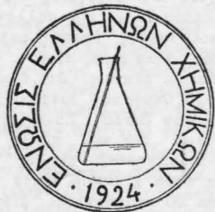
Ἡ πρώτη σφραγίδα τῆς Ε.Ε.Χ., πρὸ τῆς ἐπίσημης ἀναγνώσεώς της. (Σχεδιάσμα Κ. Δοσίου).