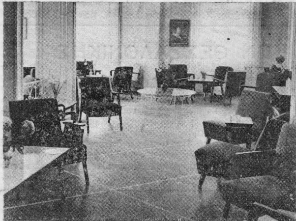
Εικ. 3. 'Η αίθουσα του 'Εντευκτηρίου διά συγκεντρώσεις και διαλέξεις.

'Αποτελείται από μια μεγάλη αίθουσα μοντέρνα επιπλωμένη, που μπορεί να χωρέσει άνετα περίπου 100 άτομα, από μια μικρότερη αίθουσα για χαρτιά, σκάκι κ.λ.π. από δύο δωμάτια όπου στεγάζονται τα γραφεία των Δ. Σ. των δύο Σωματείων, ένα δωμάτιο που προορίζεται να γίνει ένα μικρό χημικό εργαστήριο, διάφο-