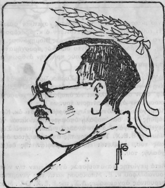
Μιχαὴλ Σκουλάτος ὁ Α'—Δαφνοστεφής.