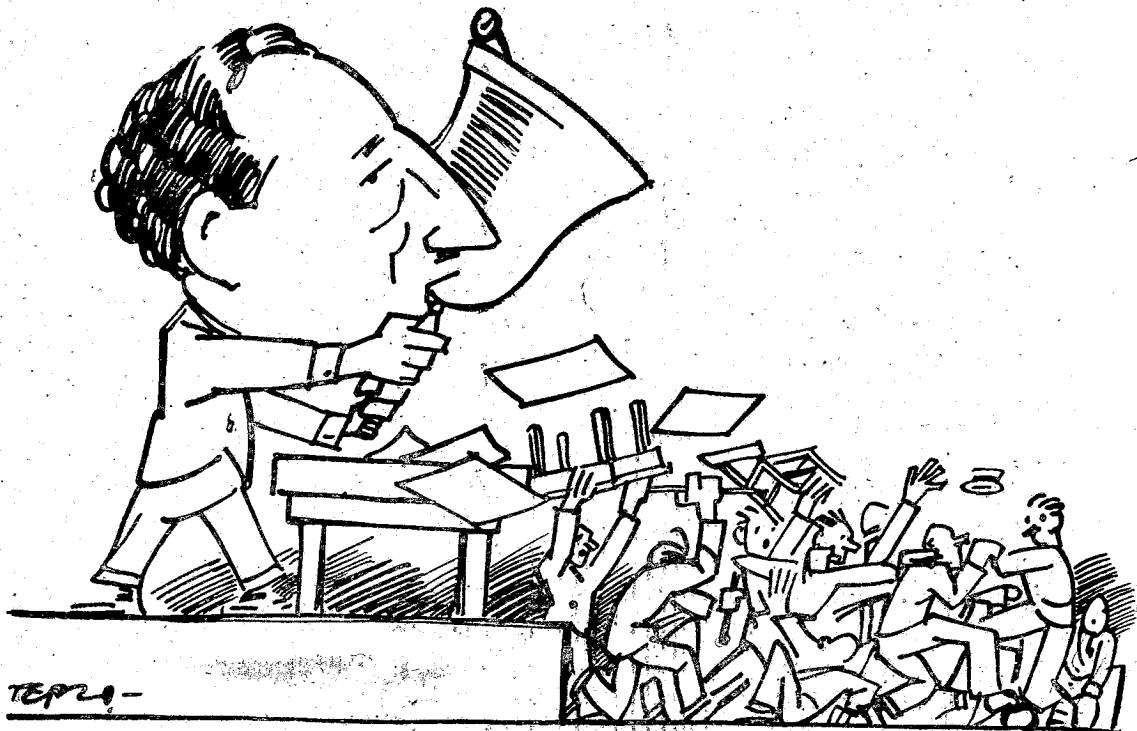
Νά μάς ζήσης κύριε Πρόεδρε (ὁ κ. Ἀγγ. Μαρανῆς).

κυρίους συναδέλφους, τοὺς ἀποτελοῦντας τὰς κορυφὰς τοῦ συνεδρίου.