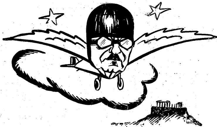
Πετάει... πετάει... (Ἕο καθηγητῆς κ. Δ. Χόνδρος).