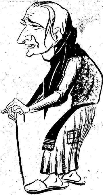
Ἡ κυρὰ - Δημητριάδαινα ἢ πολὺξερη (ὁ κ. Ι. Δημητριάδης).