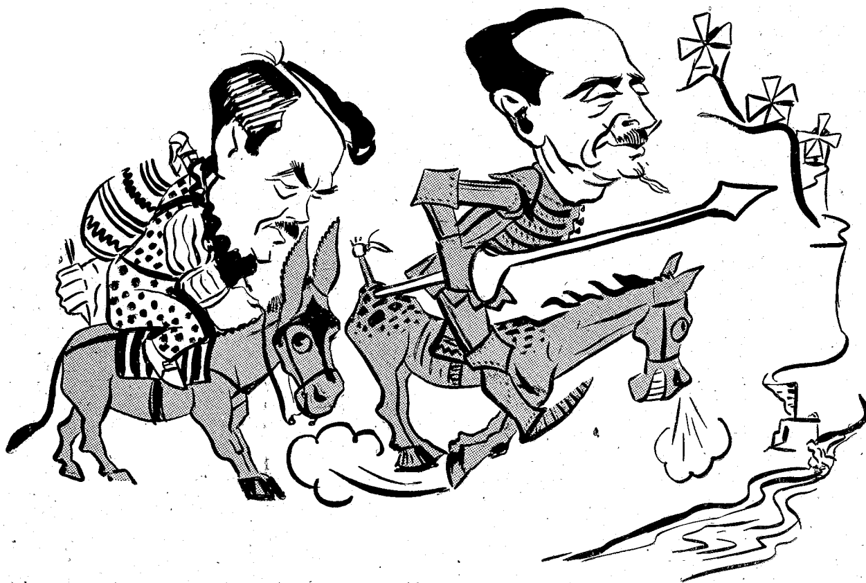
Πρὸς αὐτὸν παλαιὸν ὑδρόμυλον τῆς ρεμματιᾶς καὶ τὸν ἀνεμόμυλον τῆς κορυφῆς τοῦ λόφου . . . .»

ΑΠΟ ΤΟΝ ΛΟΓΟΝ ΤΟΥ ΑΝΤΙΠΡ. κ. ΚΩΝΣΤΑ ΚΑΤΑ ΤΑ ΕΓΚΑΙΝΙΑ ΤΟΥ ΕΝΤΕΥΚΤΗΡΙΟΥ ΧΗΜΙΚΩΝ