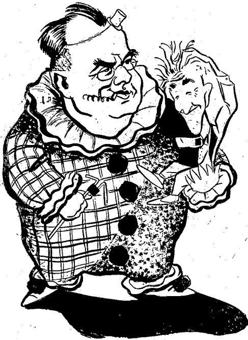
Ἐὸ Χονδρὸς καὶ ὁ Λιγνὸς (Ἐὸ καθηγητ. κ. Σ. ΓΑΛΛΑΝΟΣ)