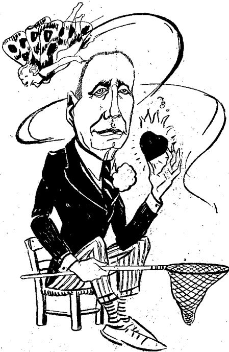
Σπουδὴ ἠλεκτρομαγνητικῶν κυμάτων (Ἐὸ καθηγητ. κ. Γ. ΑΘΑΝΑΣΙΑΔΗΣ)

Μεράκι οὐχὶ μεράκιον μεράκι εἶναι τὸ πᾶν ! Τὸ ὑβρίζειν τὸ ἐξάπτεσθαι τὸ πτύνειν κι' ἀγαπᾶν.