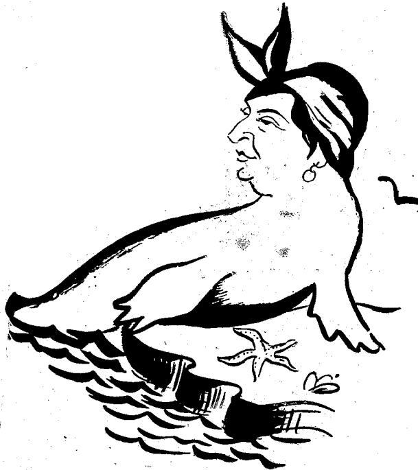
Φώκη ὁ θαλάσσιος βόυς (Phoca vitulina) ποικιλία Flyariata Polyphaga, ἀπαντῶσα εἰς τὰς ἑλληνικὰς θαλάσσας καὶ δὴ εἰς τὰς φαληρικὰς ἀκτῆς.