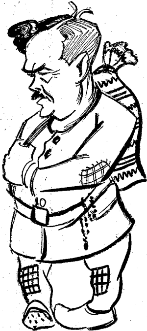
... καὶ ἐξέρχεται πρὸς ἄγραν συνδρομῶν ... (ὁ κ. Σκουλάτος ὑπάλληλος τῆς Ἐνώσεως).