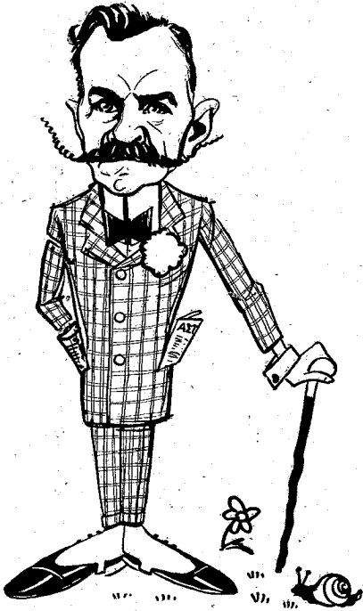
Ὁ καθηγητῆς κ. Ματθαίουπουλος ὡς εἶχε τὸ πάλαι