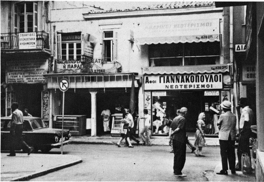
Τὸ σπίτι τοῦ Καθηγητῆ Κων. Βέη, στὴν ὁδὸ Κάνιγγος, ὅπου τὸ 1924 γίνονταν οἱ καθημερινές συναντήσεις τῶν πρώτων ἰδρυτῶν τῆς Ἐνώσεως Χημικῶν. (Φωτογραφία Ι. Κανδῆλη σύγχρονη. Τὸ παλιὸ κτήριο διατηρεῖται ἀλλὰ μὲ πολλές μεταβολές καὶ προσθήκες).