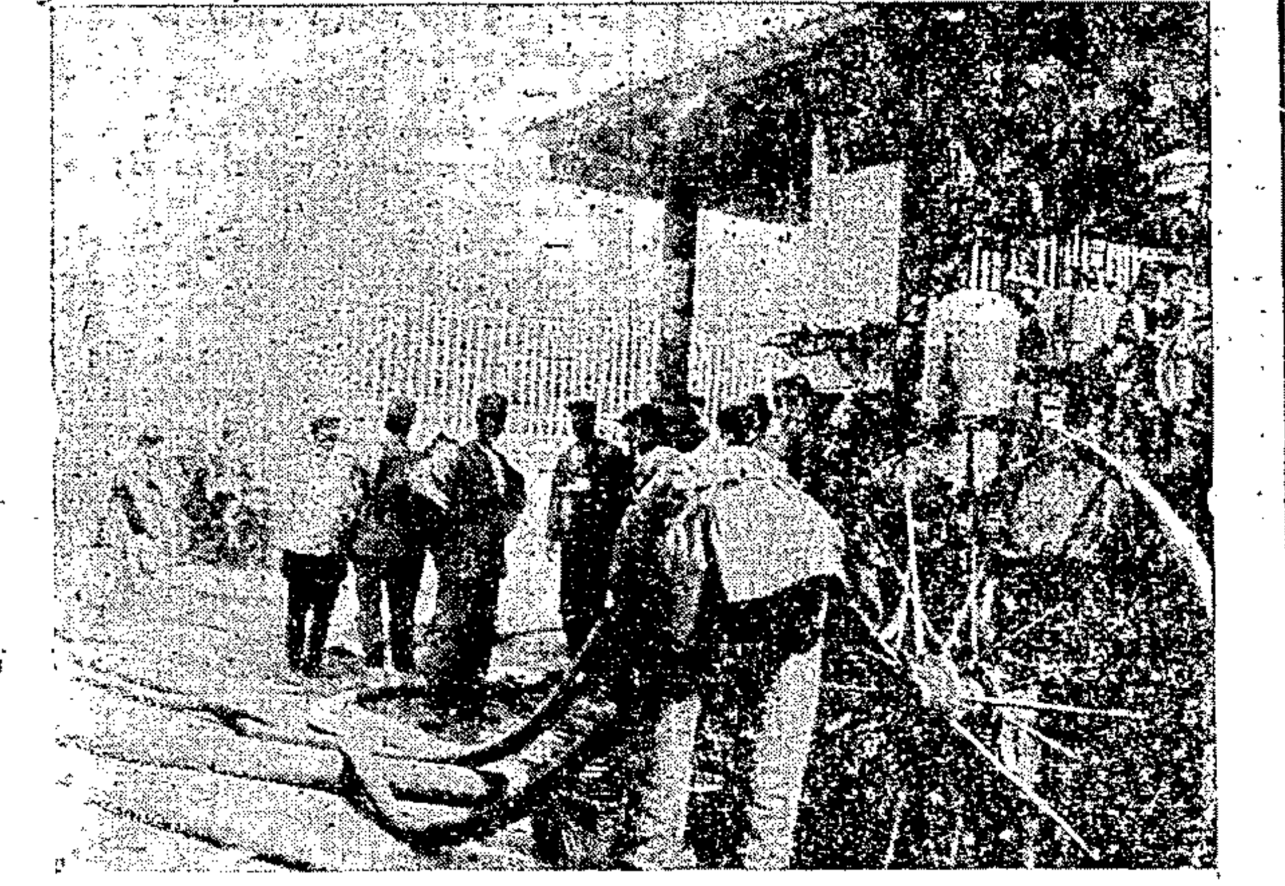
«Η άνημοκίνητος άντλία του Πυρρασθεστικού Λόχου καταγενομένη εις την κατάσθεσιν του πυρός.»

της θουραός, ανάμεσα έκεί εις την δημοσίαν συλλογήν, διά την φιλαν της άπείας χρόνια και χρόνια μισοδοσούναι φράσεις, όλοκληρον έκτελειον όμοιον ταυλίηλον.