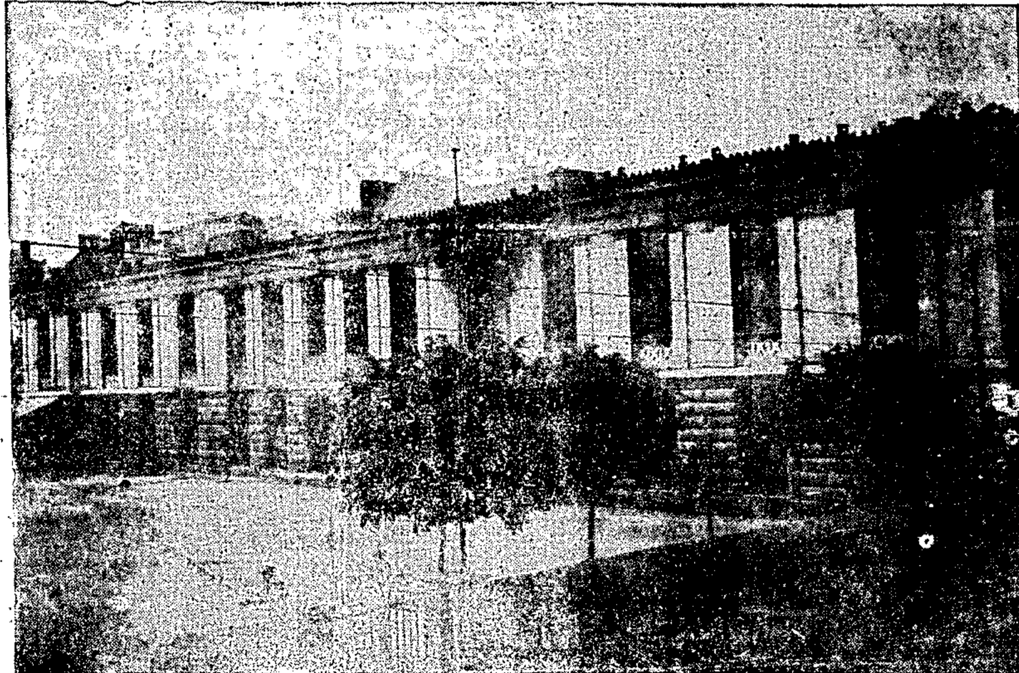
ΤΟ ΧΗΜΕΙΟΝ ΟΙΩΣ ΕΜΕΙΝΕ ΜΕ ΤΟΥΣ 4 ΤΟΙΧΟΥΣ ΜΟΝΟΝ ΜΕΤΑ ΤΗΝ ΧΘΕΡΙΝΗΝ ΠΥΡΚΑΓΙΑΝ