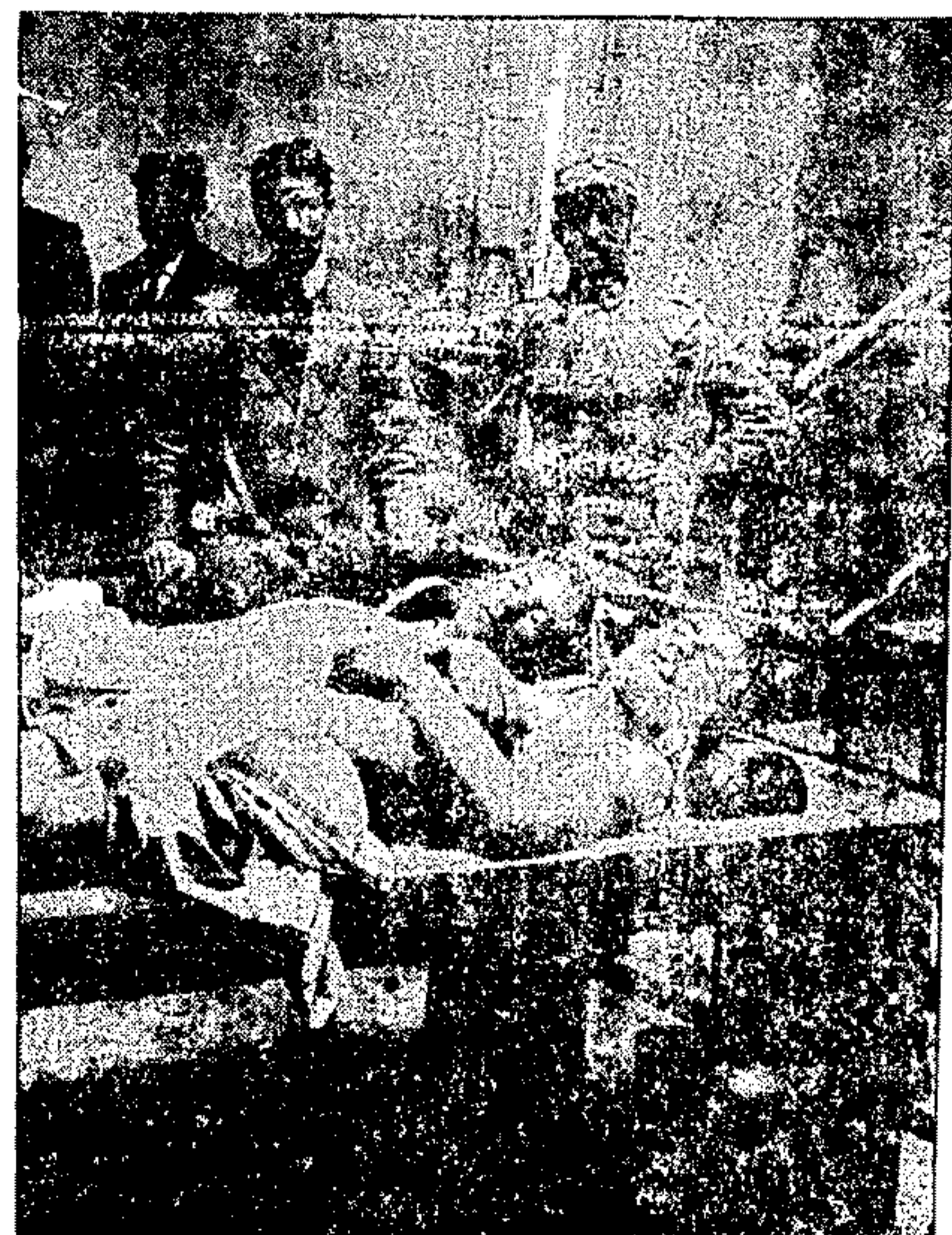
ΤΑ ΔΥΟ ΘΥΜΑΤΑ ΤΗΣ ΠΥΡΚΑΓΙΑΣ ΟΙ ΥΠΟΘΕΣΤΑΙ ΚΑΙ ΠΑΡΙΑΝΝΙΩΝ ΚΑΙ ΤΣΑΒΑΝΣ