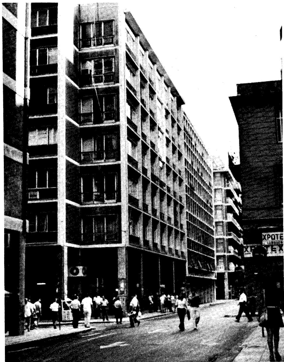
Τά νέα Γραφεία, εις τόν τελευταίον ιδιόκτητον ὄροφον τοῦ κτιρίου ἐπί τῶν ὁδῶν Καποδιστριαῖου καί Κάνιγγος 27, εις τὰ ὅποια ἐγκατεστάθη ἡ Ἐνωσις ἀπὸ τοῦ 1963.