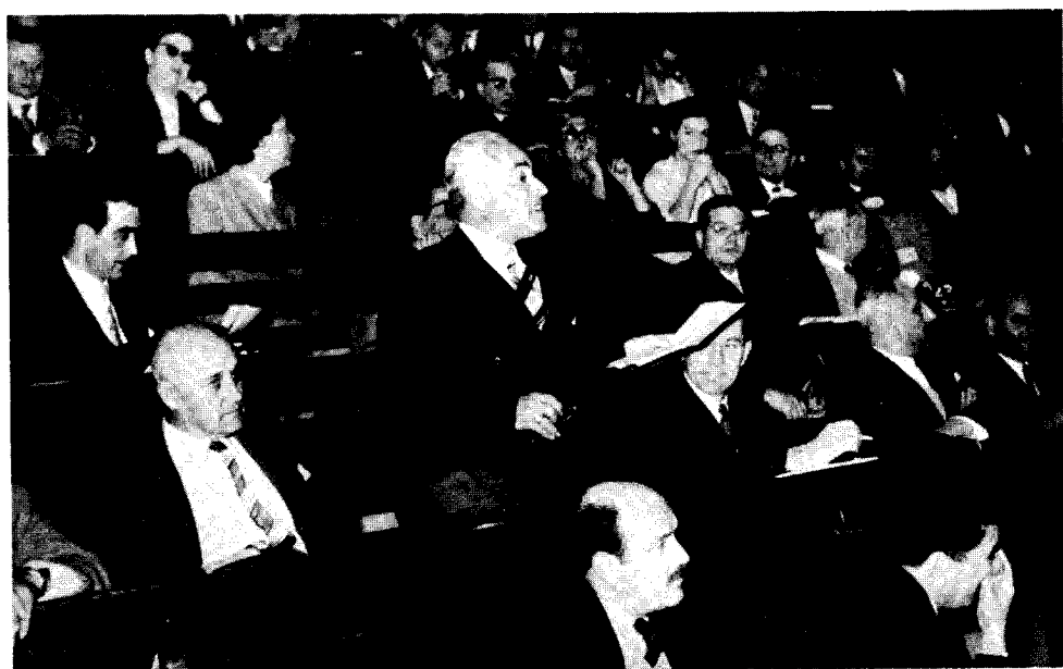
Εἰς τὸ ἀμφιθέατρον τοῦ Πανεπιστημίου κατὰ τὴν διεξαγωγὴν τῶν ἐπιστημονικῶν ἐργασιῶν τοῦ Β' Πανελλ. Χημικοῦ Συνεδρίου. Εἰς τὸ βῆμα ὁ Καθηγητὴς τοῦ Ε.Μ. Πολυτεχνείου Εὐκλ. Σακελλάριος.

Ἀπὸ τὴν Γενικὴν Συνέλευσιν τῶν μελῶν τῆς Ἑνώσεως τῆς 17ης Φεβρουαρίου 1957. Μία πλευρὰ τοῦ ἀκροατηρίου. Ὁ Ἄγγ. Δημητρίου ὁμιλεῖ ἀπὸ τῆς θέσεώς του.