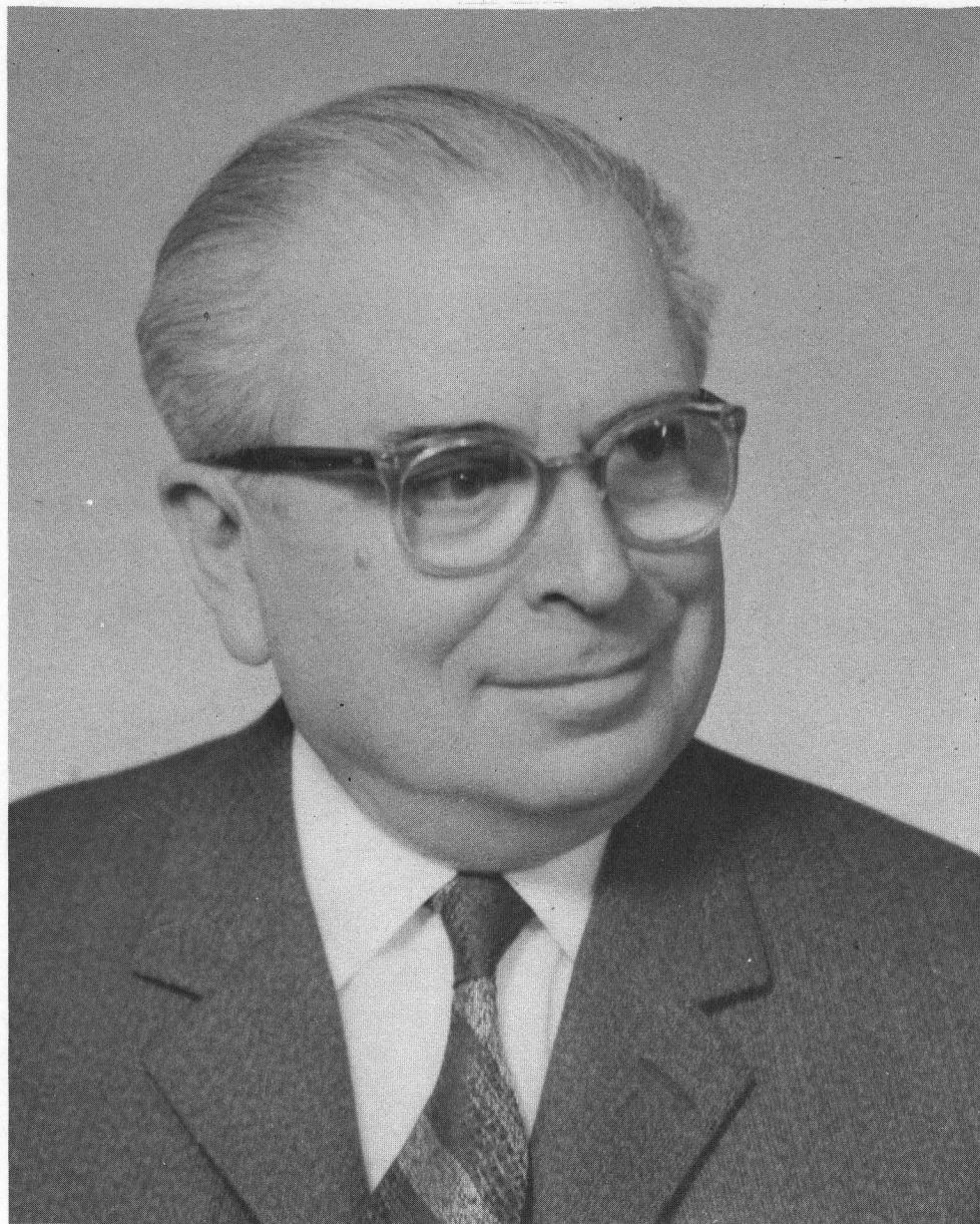
Ἰωάννης Δ. Κανδήλης

Δέκατος τρίτος Πρόεδρος τῆς Ἐνώσεως Ἑλλήνων Χημικῶν.