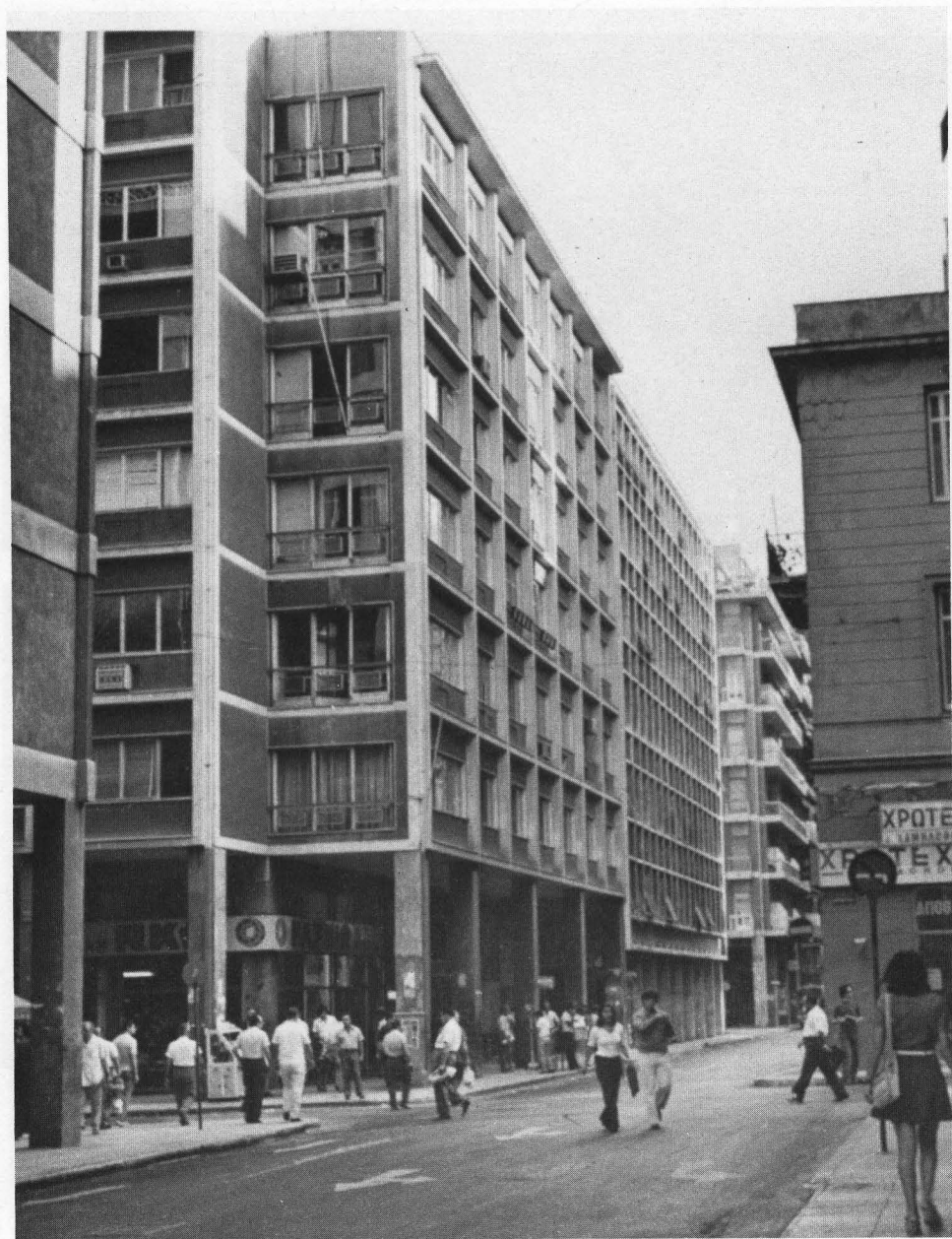
Τά νέα Γραφεία, εἰς τὸν τελευταῖον ιδιόκτητον ὄροφον τοῦ κτιρίου ἐπὶ τῶν ὁδῶν Καποδιστριαῦ καὶ Κάνιγγος 27, εἰς τὰ ὁποῖα ἐγκατεστάθη ἡ Ἐνωσις ἀπὸ τοῦ 1963.