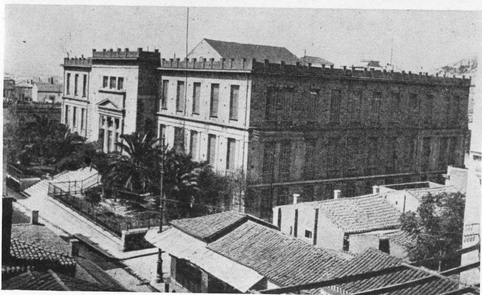
Τὸ Πανεπιστήμιον Ἀθηνῶν. Εἰς τὸ ἀμφιθέατρον τοῦ ἐγένοντο πολλὰ ἀπὸ τὰ μαθήματα κατὰ τοὺς πρώτους χρόνους λειτουργίας τοῦ Χημικοῦ Τμήματος τῆς Φυσικομαθηματικῆς Σχολῆς (Φωτογραφία τοῦ 1922).